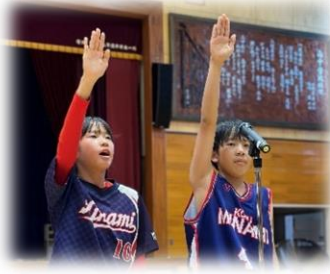
ソフト・バスケ男主将による宣誓

「3年生から確かにバトンが受け渡された」と感じた壮行会でした。各部の決意表明と選手宣誓がなされました。吹奏楽部による入退場の演奏も、3年生からバトンタッチした1・2年生が行っていました。応援生徒、選手が一体となった熱い壮行会でした。