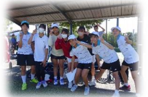
テニス女子は県新人優勝

これから県大会に出場する部は、放課後の時間が短いですが、県大会に向かって精一杯頑張りたいです。県大会に出場できない部も、冬場のトレーニングが春の花を咲かせる種となりますので、時間内でできることを精一杯やってほしいと願っています。