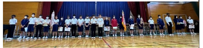
↑ 新人戦報告会の様子