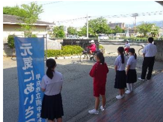
あいさついっぱいあさがお運動

4月以降、保護者の皆様には本校の教育活動に対し、ご理解とご協力いただき本当にありがとうございました。授業日数70日（1年生は71日）の1学期が