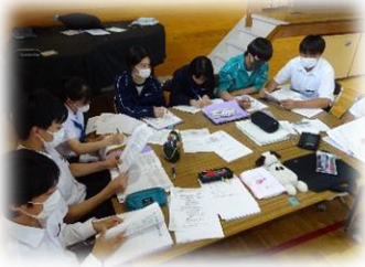
議事運営を行った生徒会本部役員

また、「縦割り清掃」では、清掃場所を固定した方がよいという修正案が、全校での活発な討議を経て可決されました。真剣に話し合っている姿を見て素晴らしい生徒総会だなと感心しました。これも生徒会本部役員を中心に原案を立て、事前に各クラスでしっかり討議された結果だと思います。「合唱チャレンジ」「きずな応援」「縦割り清掃」「あさがお運動」「南中向上委員会」という具体的活動を全校生徒一丸となって実行して行ってほしいと思っています。1つ1つの活動が、「甲府に南中学あり」と外に向かって誇りが持てるようにこれからも全校生徒で續いでいくことを期待しています。