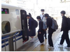
新幹線に乗り込みます

3年生の京都・奈良への修学旅行は、4年ぶりに新幹線利用となりました。3年前は、修学旅行そのものが中止になりました。2年前は、南中は河口湖の県内施設に宿泊したと聞いています。1年前は、京都までバスで移動の修学旅行でした。