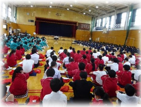
全校生徒がそろった久しぶりの生徒総会

「これまでの伝統を引き継ぎ、新しい伝統をつくりたい」「日常生活も續いでいきたい」そんな願いが込められた生徒会テ