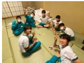
宿舎でのリラックスの2組

スローガンの「楽学両道」とおり、2泊3日の中で、2つの大きな目標を達成することができたと感じました。生徒たちの成長を目の当たりにして、これから様々な困難にも立ち向かっていく逞しさが出てきたように思います。今後の3年生にさらに期待しています。以下、生徒の感想文の一部を抜粋して掲載しました。